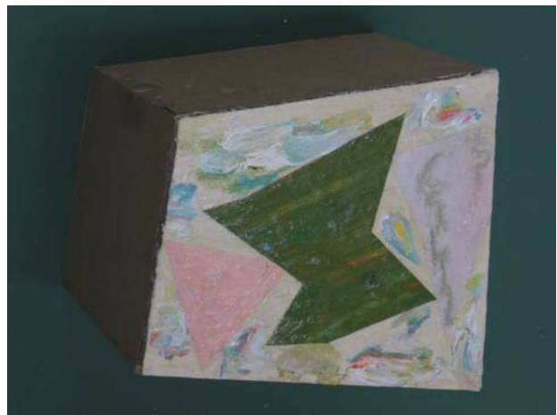
岡田匡史 「野」段ボール、古封筒、アクリル 2017年