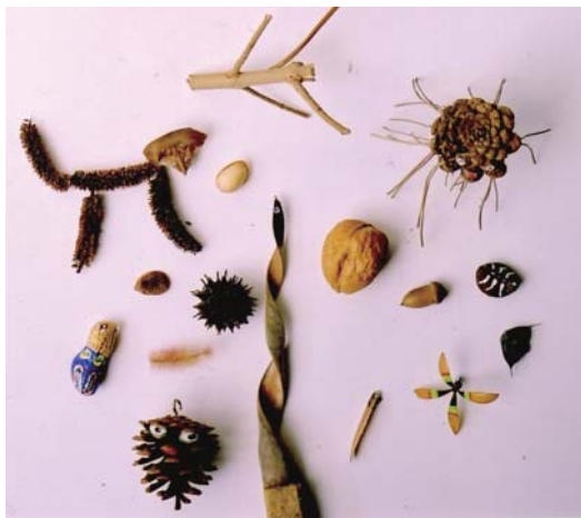
笹井 弘作品 動植物オールキャスト