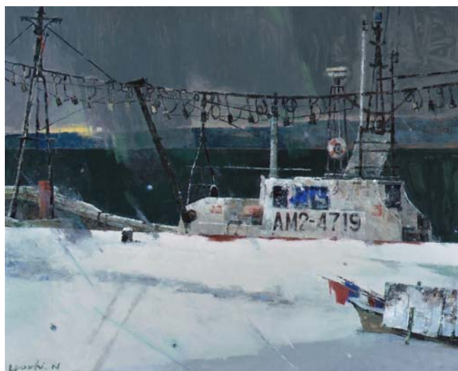
中澤嘉文 何処へ (鯨ヶ沢漁港)

開館時間 9:00~17:00 (最終入館 16:30) 休館日 月曜 (祝日の場合 翌日) 入館料 無料 同時開催 私の愛する一点展 (入館料 600円)